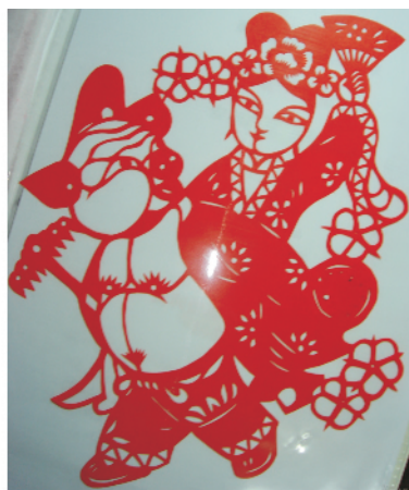
图1 质量的可加性。 M(\text{猪八戒背媳妇}) = M(\text{猪八戒}) + M(\text{高小姐})

(物质的量)的呢?牛顿认为物质的量为物质的密度乘上其体积。这个说法也许某个中学生都敢讥讽其太简单,但其实大有深意(1)它指明物质质量上的区别应该在致密度(density)这个更深、更抽象的层次上(2)物质的量是体积那样的广延量,即质量具有可加性且由体积的可加性来保证(或者说把可加性甩给了体积,这是个比广义相对论还难的问题 1) ),并由此向不同物质体系扩展(图1)。在一些物理文献中,质量相加性被誉为牛顿第零定律(诺贝尔奖得主Wilczek就持这样的观点),其重要性可见一斑。牛顿还用了pondus这个词来描述物质的量,这个字就是称量的意思,至今英国的质量单位还是这个词,Pound(磅),一磅合454克。相关联的动词ponder一般英汉词典会解释为思考,确切点愚以为应翻译成掂量或曰权衡!