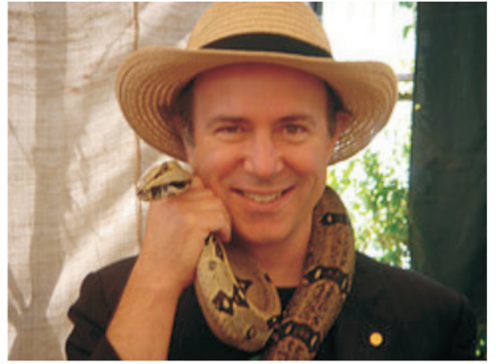
图4 质量起源的诠释者之一、2004 年度的诺贝尔物理学奖获得者 Frank Wilczek 教授

教授认为,量子色动力学(QCD)是理解经典力学的基础(不知大学基础课该如何安排). 物质的质量来自原子,原子质量主要来自核子,核子由夸克组成,但夸克由无(惯性)质量的夸克组成. 囚禁夸克的能量在核子层面上表现为质量. 这算是对核子质量起源的一个交代,但对电子质量的起源,目前尚无理论上的解释. 可能,关于质量的起源,最终还是落在无质量的存在上,有点类似道家的‘有生于无’的思想. Wheeler 教授(参阅 J. A. Wheeler, Geometrodynamics)就宣扬‘mass without mass(没有质量的质量)’的观点; to remove any mention of mass from the basic equations of physics(要把质量的概念从所有的基本物理方程中剔除). “不知这一伟大壮举将来要着落在谁人的肩上.”